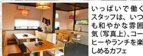
いっばいで働くスタッフは、いつも和やかな雰囲気(写真上)、コーヒーやランチを楽しむカフェ