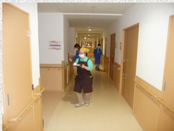
施設外就労 清掃と喫茶