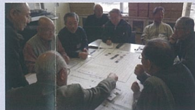
避難所運営シミュレーション講座の様子